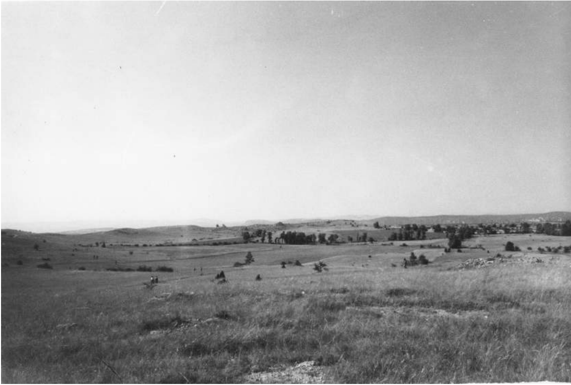
Le Causse du Larzac en 1975

Le plateau se présente comme un paysage ouvert, occupé par une steppe-pelouse. Il est utilisé en parcours extensif à moutons, piqueté d'arbres, isolés, en bosquets, ou en ligne, au bord des quelques chemins qui le sillonnent. La roche calcaire blanche affleure, en blocs parfois ruiniformes.