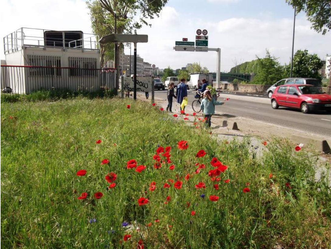
Saint-Denis, printemps 2013

En bordure d'une route très circulante qui longe la Seine, un terrain vague, où les graminées prennent l'aspect d'une verte prairie, dont émergent coquelicots et bleuets, offre sa floraison éclatante aux passants.