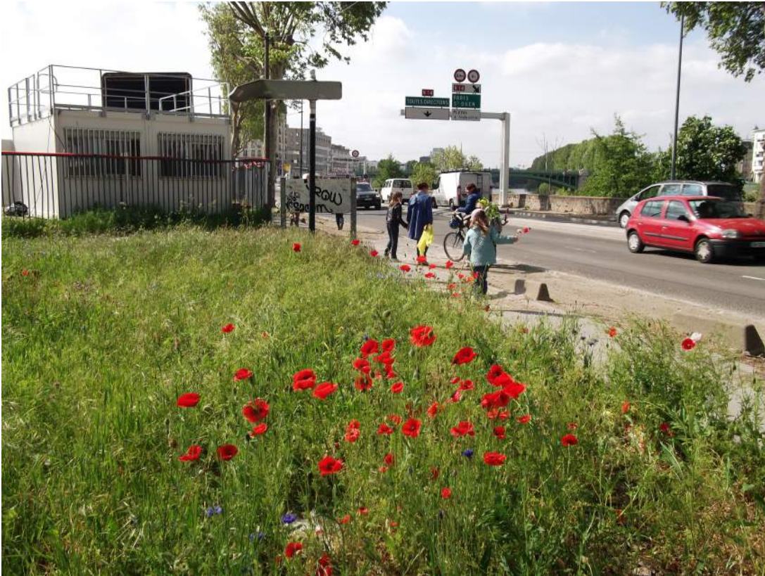
Saint-Denis, printemps 2013

En bordure d'une route très circulante qui longe la Seine, un terrain vague, où les graminées prennent l'aspect d'une verte prairie, dont émergent coquelicots et bleuets, offre sa floraison éclatante aux passants.