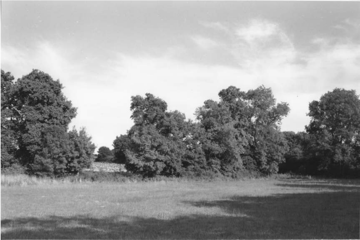
Le bocage breton dans les environs de Notre-Dame-des-Landes (Loire-Atlantique), août 2013

Ce bocage à mailles serrées a gardé sa géométrie d'origine; mais les haies (où les chênes sont dominants) n'y ont pas été taillées depuis un certain temps. Un arbre manque, et le regard trouve une échappée plus loin, au-delà de la prairie du premier plan, vers un champ déjà récolté.