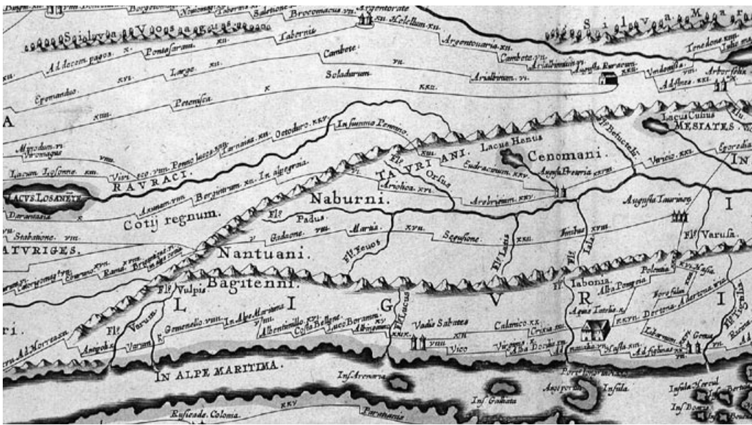
Abb. 1: Ausschnitt aus der Tabula Peutingeriana mit dem Gebiet zwischen dem Genfersee und dem Bodensee. Historischer Atlas von Georg Horn (Erstausgabe in Kupfer gestochen bei Johannes Janssonius in Amsterdam 1653); Neuauflage Amsterdam 1684 (Landesbibliothek des Kantons Glarus).