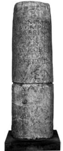
Abb. 4 (links): Meilenstein des Kaisers Caracalla bei St-Prex (Walser III, 1980, 160 f. Nr. 318).

Auch Strassennamen könnten auf die Römer hinweisen, so zum Beispiel «Heidenweg», «Hochsträss» oder «Hochgsträtt» (Abb. 9). Lange nahm man an, dass die Römer ihre Strassen auf einem Damm errichteten, der dann aus dem Gelände herausragte und somit später als «Hochsträss» be-